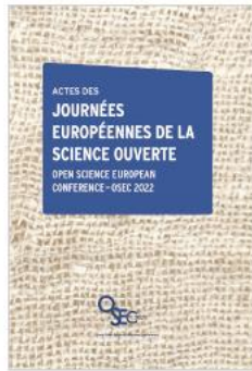
Actes des Journées européennes de la science ouverte