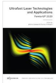
Ultrafast Laser Technologies and Applications - FEMTO-UP 2020