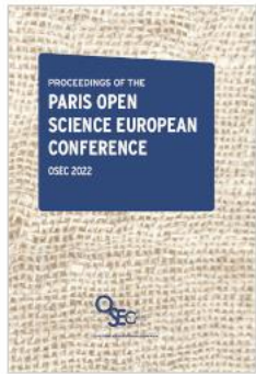
Proceedings of the Paris Open Science European Conference